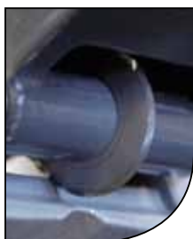
Rodel de carburo Ø22 x 6 x 5mm Scoring wheel TUNGSTEN CARBIDE