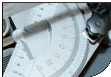
Escuadra graduada Angle square