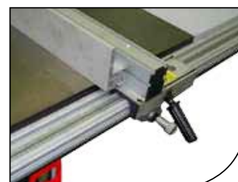
Tope guía con regulación micrométrica Precise and ultra sized fence guider

La maquina se entrega con el tope guía de regulación, el tope de corte, 1 sierra circular carburo ø315 de 40 dientes, 1 incisor extensible ø100 de 2x12 dientes, las extensiones de mesa, el prensor, la guía para ingletes, llaves y manual de utilización.