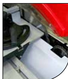
Disco ø315 con inclinación 45° e incisor ø100mm Blade ø315 mm with 45° cutting angle, scoring blade ø 100 mm