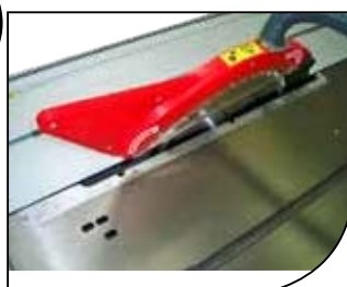
Carro 2000mm a ras de la sierra Sliding table's guide 2000 mm