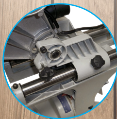
Tête avec coulissement radial