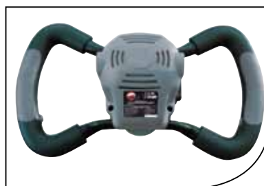
Empuñaduras paralelas Parallel handles