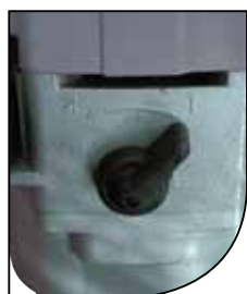
2 velocidades 2 speeds Slow / fast