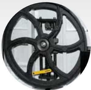
Volants en fonte d'acier équilibrés Gietijzereen uitgebalanceerde vliegwielen