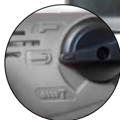
Selecteur 3 modes Afstemknop 3 standen