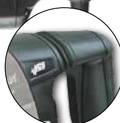
Poignée anti vibrations Handgreep anti - trilling