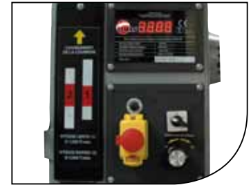
Variador electrónico Variable speed