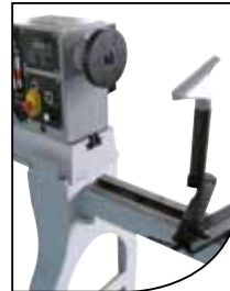
Extensión y apoyo de gubias exterior Extension bed